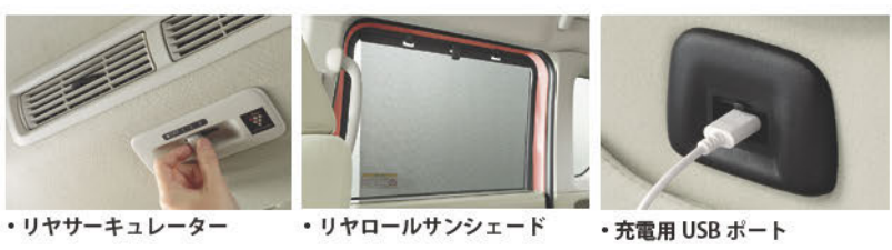
・リヤサーキュレーター ・リヤロールサンシェード ・充電用 USB ポート

さらに! ★運転席、助手席ヒートシーター ☆助手席側ハンズフリーオートスライドドア 等々