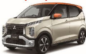
Photo : T ナチュラルアイボリーメタリック /サンシャインオレンジメタリック(有料色) (上記ご利用料に有料色・付属品は含まれておりません)

お支払回数(ご利用期間) : 60回(60ヶ月) 契約月間走行距離 : 1,000km/月 平月お支払額 : 19,800円(消費税込)回×51回 初回おまとめ払い(頭金) : 330,000円(消費税込) ボーナス月お支払額 : 75,900円(消費税込)×9回 ※60ヶ月間のお支払総額2,022,900円(消費税込)