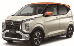
Photo : T ナチュラルアイボリーメタリック /サンシャインオレンジメタリック(有料色) (上記ご利用料に有料色・付属品は含まれておりません)

月々 22,110 円 (消費税込) ご利用料総額 2,140,710 円 (消費税込)