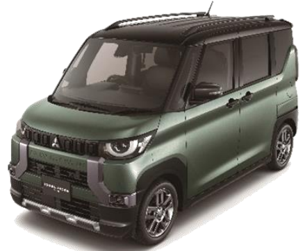
DELICA MINI Photo：T Premium アッシュグリーンメタリック/ブラックマイカ（有料色） ●写真は4WD